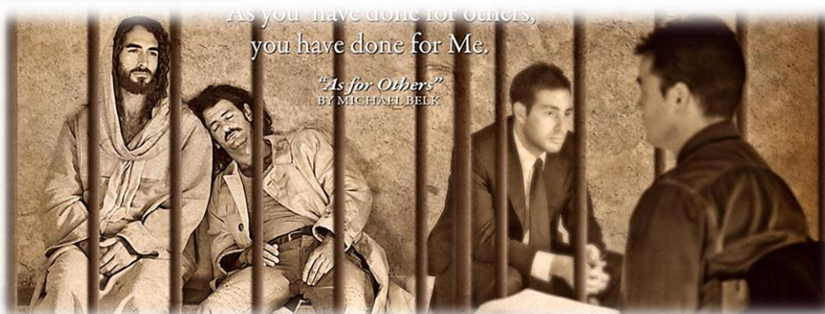
photo source: Jonathan Byrne, professional artist www.reedeemer.com