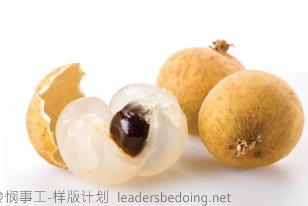
起动怜悯事工-样板计划 leadersbedoing.net